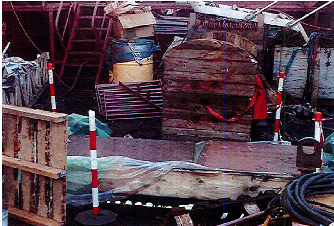
Abbildung 5: Situation auf dem Hauptdeck nach dem Zwischenfall: Mit Holz und Metallblech abgedeckte Wartungsluke und vier rot-weiße Pfosten zum Schutz angebracht. Der Bereich um die Wartungsluke herum ist mit Baumaterial verstellt.

Nach Angaben der Direktion für Völkerrecht des Eidgenössischen Departements für auswärtige Angelegenheiten sei der Unfall dem Schweizerischen Seeschiffahrtsamt nicht gemeldet worden.