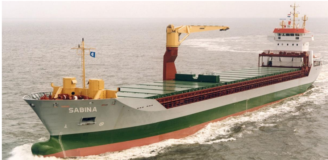
Abbildung 1: Der 128-Meter-Mehrzweckfrachter SABINA, hier während einer Probefahrt im Jahr 2000. Der Anstrich des Schiffes entspricht nicht demjenigen am Unfalltag.

Die SABINA war ein 128 Meter langer Mehrzweckfrachter (vgl. Abbildung 1), der seit Indienststellung im Jahr 2000 und bis zu seinem Verkauf im Jahr 2017 durch die Enzian Ship Management AG bereedert wurde. In dieser Zeit, bis zum 1. Juni 2017, lief das Schiff unter Schweizer Flagge.