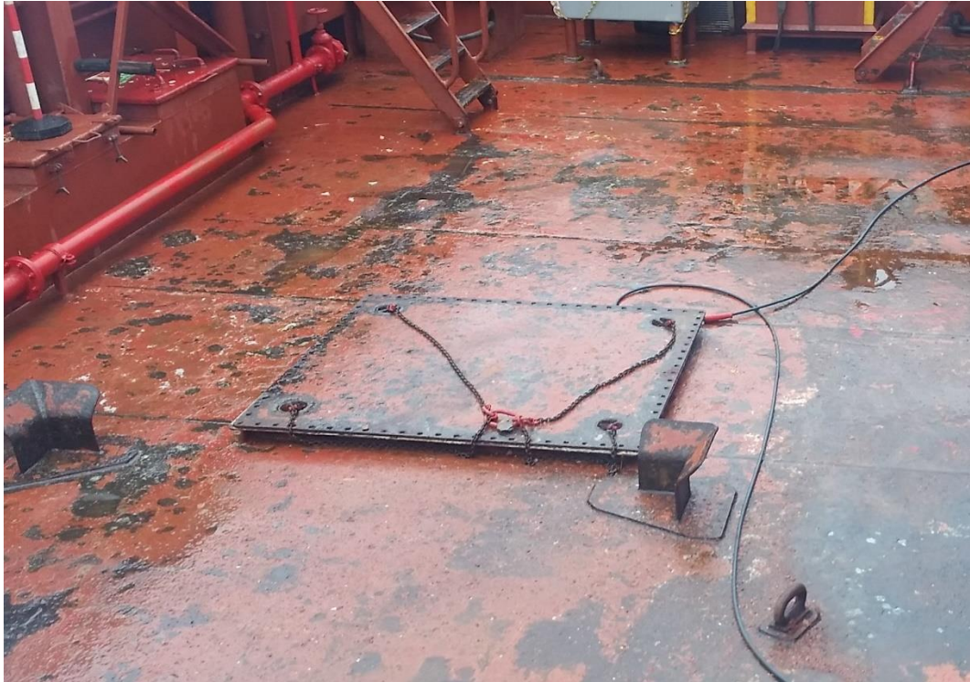
Abbildung 4: Die Wartungsluke auf dem Hauptdeck in geschlossenem Zustand. Gut erkennbar ist das nur wenige Zentimeter hohe Lukensüll sowie Ketten, die zum Anheben des Lukendeckels an diesem befestigt wurden.