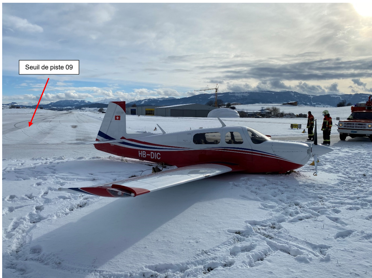
Figure 1 : Le HB-DIC dans sa position finale à quelques mètres du seuil de piste 09 de l'aérodrome d'Ecuwillens (LSGE), en regardant vers l'est.

Le matin du 26 janvier 2021 le pilote a effectué un vol d'environ quarante minutes de Birrfeld (LSZF) à Ecuwillens (LSGE) avec l'avion à moteur Mooney M20J, immatriculé HB-DIC. La piste d'Ecuwillens était légèrement contaminée au moment de l'arrivée. Lors de la première approche sur la piste 27, la vitesse en approche finale était légèrement trop élevée. Après s'être posé dans le premier tiers de la piste, le pilote a décidé de redécoller et a effectué un circuit. Lors de la deuxième approche sur la piste 27, deux témoins oculaires ont vu l'avion en finale avec le train d'atterrissage rentré. Après l'atterrissage sur le ventre, l'avion a dérapé jusqu'à l'autre extrémité de la piste et s'est immobilisé dans la neige à quelques mètres après seuil de piste 09 (figure 1). Le pilote, seul à bord, n'a pas été blessé, l'appareil a été gravement endommagé.