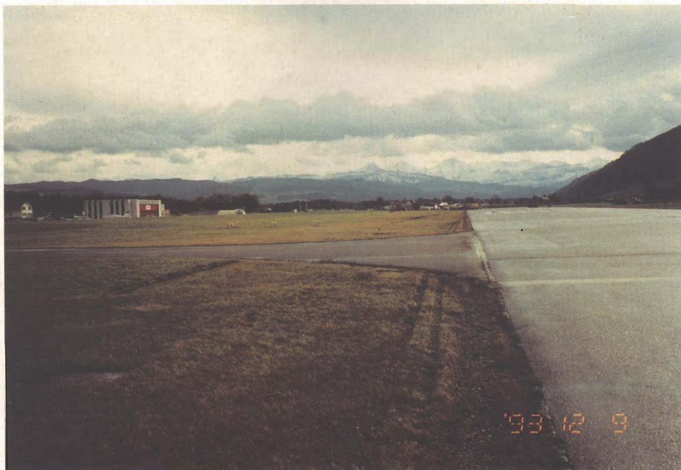
Endlage und Fahrwerkspuren im Gras/Still stand position and landing gear marks